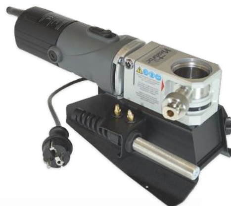
Neutrix mit Standfuß SW

Für den Werkstattbetrieb kann ein Standfuß montiert werden.