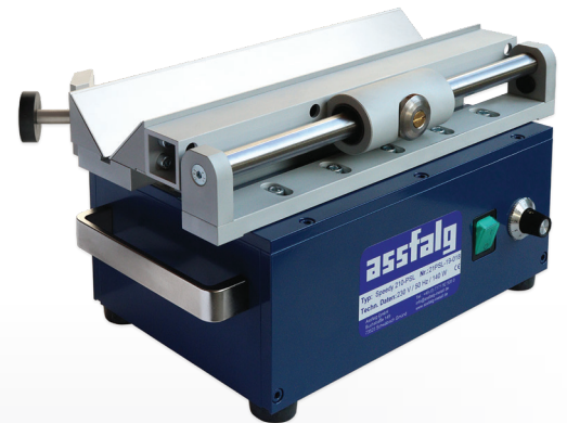
Speedy Prisma 210-PSL

Diese Entgratmaschine ist eine einfache und stabile Tischmaschine mit einem prismatischen Schiebeschlitten für eine rationelle und präzise Bearbeitung von Längskanten an kleinen und kleinsten Werkstücken.