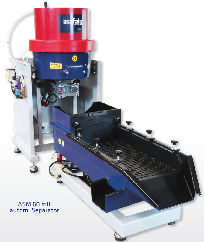
ASM 60 mit autom. Separator

Die Fliehkraftanlagen ASM sind ideal für Kleinteile. Durch eine höhere Bearbeitungsintensität entgraten sie 10-20 mal schneller als Gleitschleifmaschinen. Die Fliehkraftanlage ist als Einzelgerät, bis hin zu einer vollautomatischen Anlage planbar.