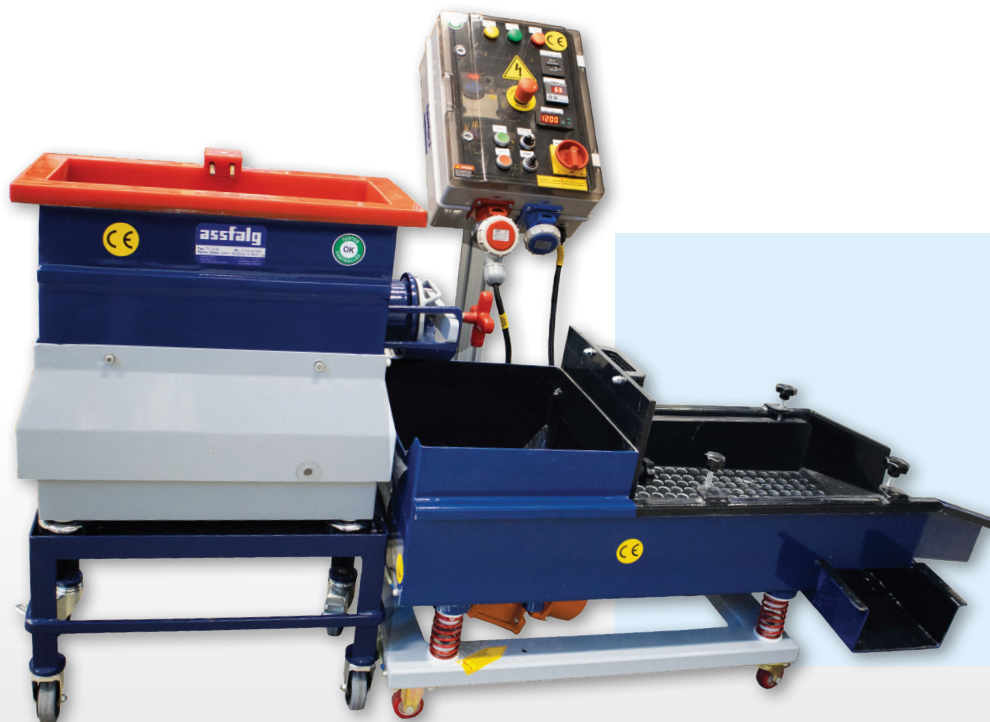
TV 15-SL mit Separator